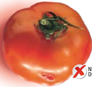
■ Oštećeni paradajz