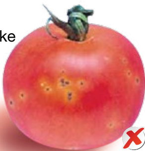
■ Bakterijske mrlje